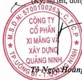
Tô Ngọc Hoàng

Ghi chú: Những chỉ tiêu hoặc nội dung đơn vị không có số liệu hoặc thông tin thì không phải trình bày và không được đánh lại số thứ tự chỉ tiêu và “Mã số”.